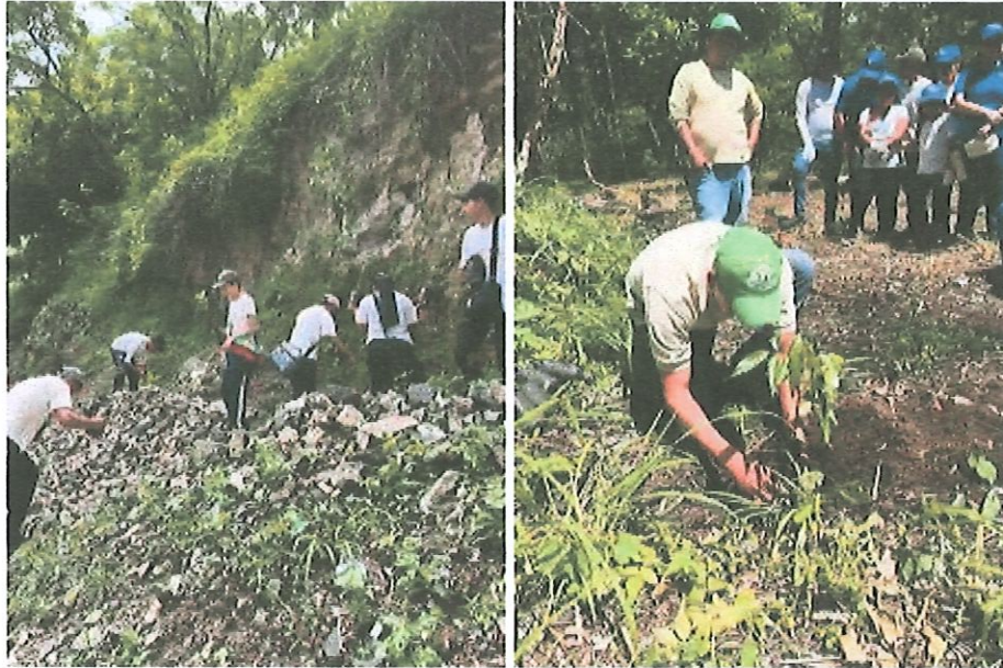
Foto 5 y 6: Personal guardarecursos reforestando y producción de plantas nativas en PNNU (fotos de julio 2024)

Se establecieron las 5 hectáreas de reforestaciones en el parque, en los lugares que sufrieron incendios forestales.