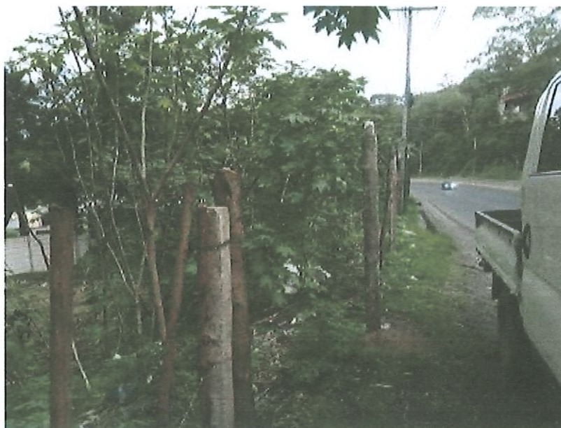
Foto 3: ilícitos detectados y participación en inspecciones oculares del MP