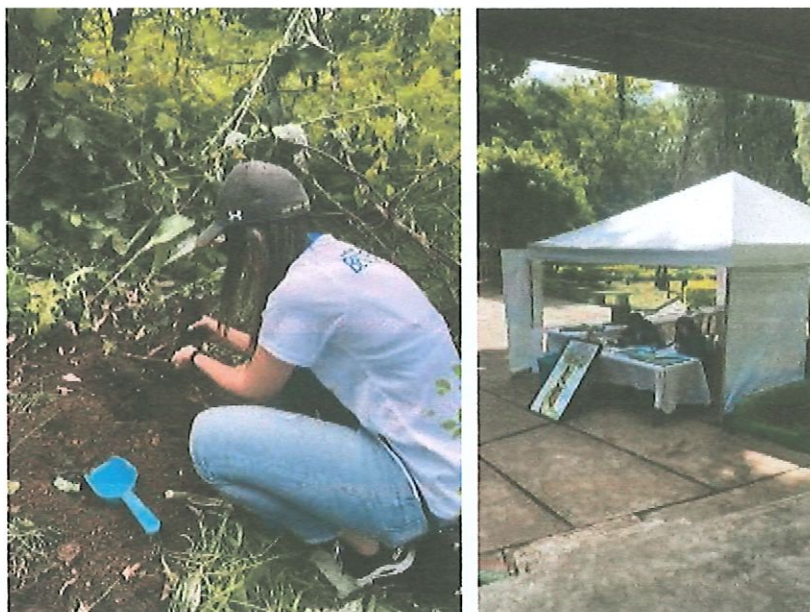
Foto 15, 16, 17 y 18: actividades de educación ambiental descritas.