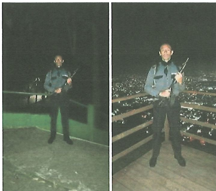
Foto 12 y 13: Personal de vigilancia para prevención de incendios forestales las 24 horas del día.

5.8 Otorgar la cooperación técnica y financiera a la Fundación Defensores de la Naturaleza necesite, siempre que se encuentre dentro de sus posibilidades para el desarrollo dentro del Parque Nacional Naciones Unidas de proyectos de Conservación y Manejo de la Cuenca, considerando que el terreno de este Parque Nacional es parte importante de la Cuenca del Lago de Amatitlán, por lo que se hace necesario realizar actividades de protección y manejo de la misma, incluyendo Educación Ambiental dirigida a estudiantes y población que visita el mismo.